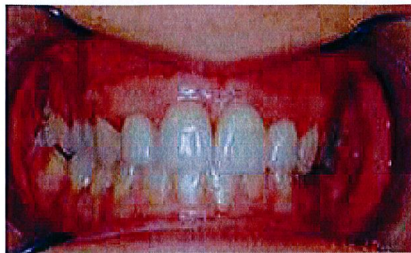
In alto il prima e il dopo di una riabilitazione protesica con corone in ceramica e trattamento ortodontico in paziente adulta.

l'attenzione a tutte le problematiche ortodontiche dei pazienti in crescita. Accurate diagnosi e adeguati trattamenti in età precoce possono correggere o prevenire l'instaurarsi di gravi malocclusioni. Su pazienti adulti il dottor Pasquali esegue tutti quei trattamenti di ortodonzia "invisibile" tra cui lo straordinario Invisalign che, senza intaccare l'aspetto estetico dell'assistito, ricorre a mascherine trasparenti e rimovibili per il progressivo spostamento degli elementi dentari da correggere. Anche in campo protesico importanti novità connesse a recenti studi implantologici consentono di realizzare, anche in gravi casi di atrofia ossea, estese riabilitazioni attraverso tecniche di rialzo del seno mascellare, mediante lo split crest e la rigenerazione guidata. Nello studio del dottor Pasquali si effettuano anche impianti a carico immediato grazie ai quali si recupera la funzione masticatoria e l'originale aspetto estetico in soli tre giorni e senza dover ricorrere alle protesi mobili. In totale assenza di materiale metallico, un effetto bio-compatibile si può inoltre avere dall'impiego di corone e ponti caratterizzati da una struttura in ossido di zirconio e una superficie esterna in ceramica realizzata con il metodo Cad-Cam. In alcuni casi, per una riabilitazione delle funzioni e dell'estetica dentale, l'esperto dottor Pasquali, in sostituzione a vecchie amalgame può adoperare corone in ceramica integrale. Il medico chirurgo è inoltre specializzato nell'uti-